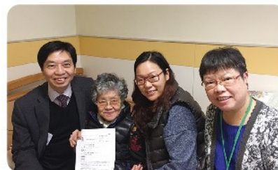
▲簽署預設醫療指示後，長者笑逐顏開

本計劃向長者推廣預設照顧計劃，讓長者可在預先表達將來面對臨終時的意願。經本計劃社工和護士講解和安排，有不少長者深思後決定簽署預設醫療指示，以下是部分長者和家人的心聲：