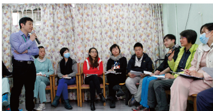
▲計劃社工帶領互動工作坊